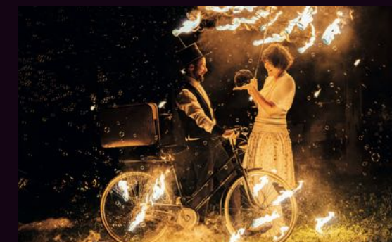
Cie Herz Feuer

Il attrape des étincelles avec une canne à pêche puis danse un pas de deux avec un hula-hoop enflammé ou un parapluie. Un spectacle dynamique qui saura mettre des étoiles dans les yeux des petits comme des grands !