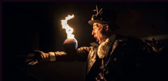
Cie Petit Grimoire